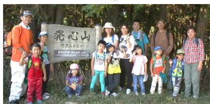
5歳児 「のぼったぞー！」 ちょっとお疲れ気味・・・