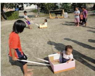
慌てず安全運転をお願いします。