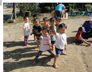
はちまきしめて頑張るちゅうりっぷ組