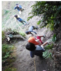
スリル満点の斜面すべりに大はしゃぎ