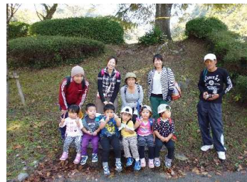
2歳児 ちゅうりっぷ組