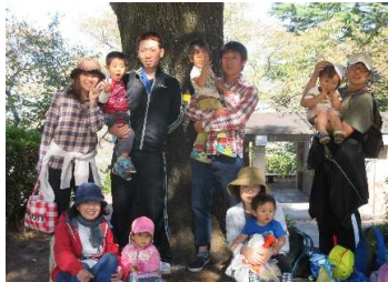
1歳児 すみれ組 いっぱいいっぱい歩いたよ！

秋空の広がる中、各クラス目的地目指して出発して行きました。 親子一緒とあって子ども達の顔もほころんでいました。 子ども達との何気ないおしゃべりや同じ時間を共有する中でわが子の新たな発見があった親子山登りではなかったかと思えます。