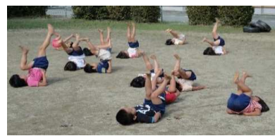
憧れの年長リズムをする3.4歳児