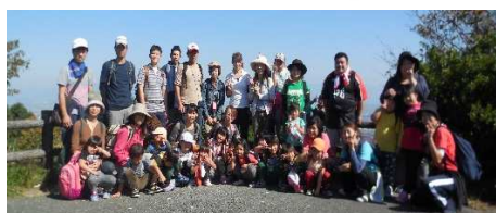
3.4歳児高良山にて。ハイチーズ！