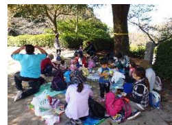
1番の楽しみはお弁当！