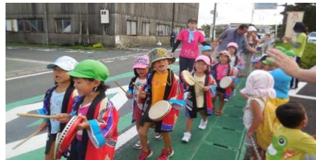
ゆり組も「わっしょい」の掛け声の後に太鼓をならし神輿の後を歩いていきました。