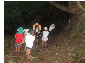
早起きして昆虫獲り