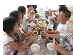
梅ジュースでカンパニー！