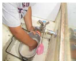
お米をといでの飯ごう炊飯