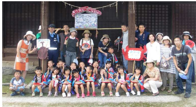
到着後、応援してくださった皆さんと記念撮影