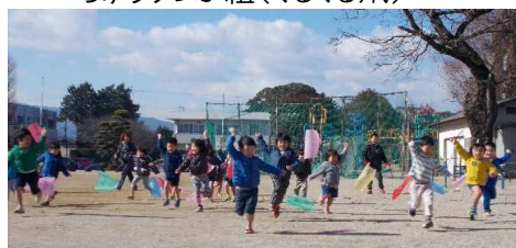
たんぽぽ・ゆり組(ビニール凧)

自分たちで作った凧をもってつばき公園や小学校の 運動場におじゃましての凧揚げをしました。 「あがった あがった」の声に一段とスピードあげ走り まわる子ども達でした。