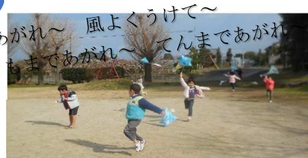
ひまわり組(ダイヤ凧)