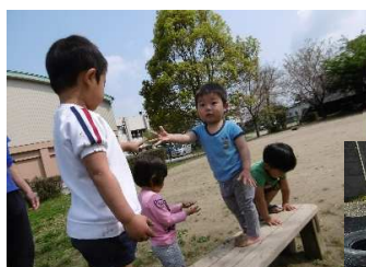
ベンチで山道ジャンケン