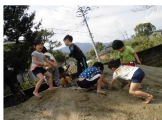
ダムづくりは力仕事！

朝から気温がぐんぐん上がり半袖一枚になり、泥んこ遊びがはじまりました。築山にダムを作り水を流しはじめるといつの間にか沼ができて、はまり込んでみんなで泥んこ、いい笑顔！