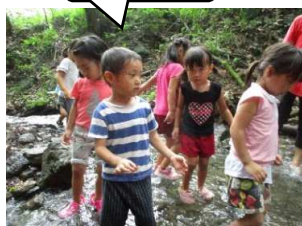
中村っ子みんながカニを 掴めました！