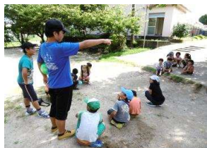
メンバー選び、真剣です

7月15日にキックベース大会を開催！小学生18名と年長さんが参加。 第1試合は各チーム、6年生がリーダーになり、メンバーを選抜。試合前には、ルールを確認し合いました。 ルールを知らない年長さんや1・2年生にもわかりやすく、寛容なルールをみんなで考えてくれました。 5回裏で終了とし、第1試合開始。