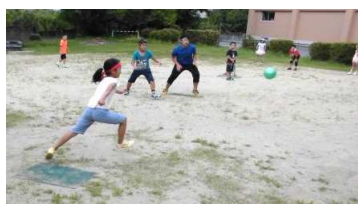
守る方は、蹴る子を見て配置を考えます 蹴る方は、守りの配置を見て蹴ります