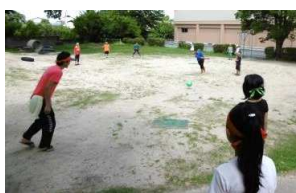
職員もチームのため真剣です！