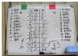
延長11回までの熱戦の末、 赤チームのさよなら勝ち！ 負けたチームは悔しそうでしたが、 最後には、みんな 「楽しかった！またしたいね！」 と、言ってくれていました。