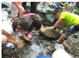
中村っ子も石をひっくり返し 探し始めました