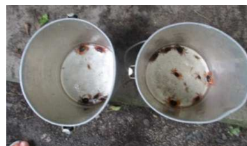
バケツにたくさん捕まえられたので、 子ども達はとても満足気でした。