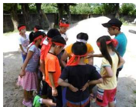
打順決め、悩みます

第2試合は、子どもたちのリクエストで職員2人がリーダーの赤チームと6年生2人が緑リーダーのチームとの対戦。 こちらもリーダーがチームを選抜し、9回で勝負がつかなければ試合延長となりました。