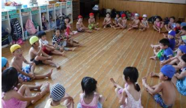
発心も中村もやっているあいうべ体操を一緒に

一緒にあいうべ体操やリズムをしてプールに入りました。みんなで「洗濯機（せんたつき）」と走って、流水プールにして遊びました。