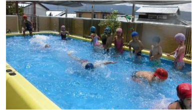
最後はイルカジャンプをしてから端まで泳ぎます！