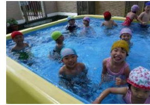
大きいプールに満面の笑みの子どもたち