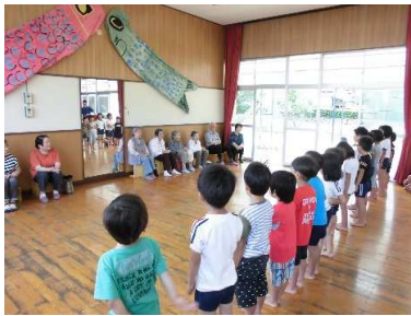
手遊びと歌のプレゼント「こいのぼり」を一緒に歌いました

15日に紅桃林団地の方々を招いて、いきいきサロンを行いました。祖父母様10名の方が参加して下さいました。