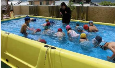
だるまさんになって3秒間水に浮けるかな～