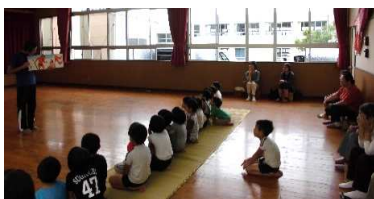
大型紙芝居で昔話『いつすんぼうし』世代を越えて、わかり合える物語はいいですね☆