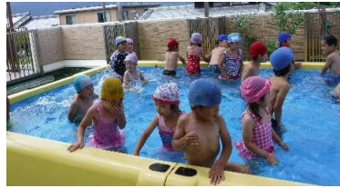
プールに入るとすぐに水かけごっこで大盛り上がり