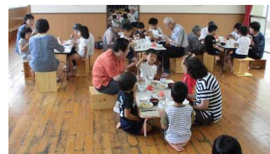
一緒に食事もし、おじいちゃんおばあちゃんも子どもたちも笑顔があふれます